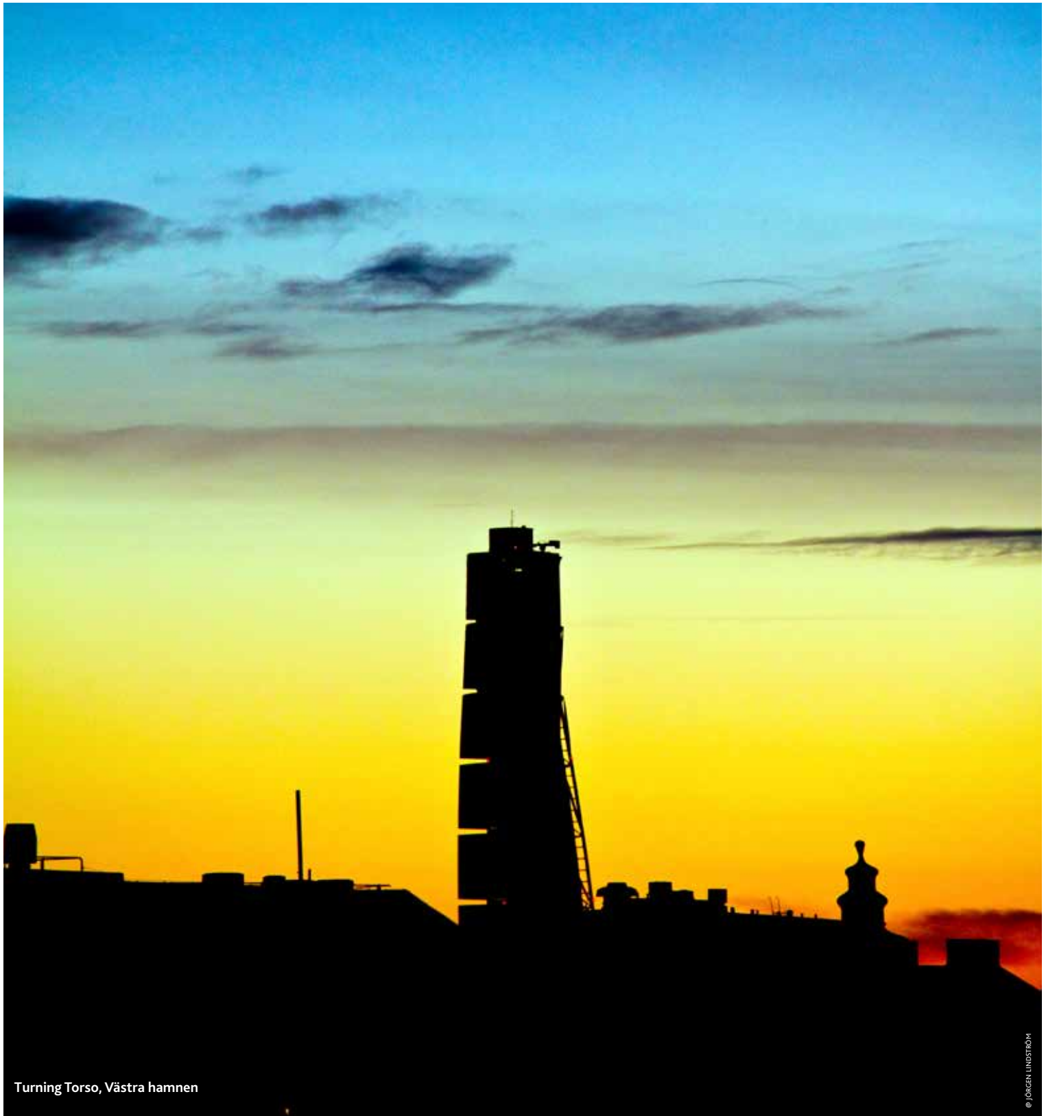
Turning Torso, Västra hamnen