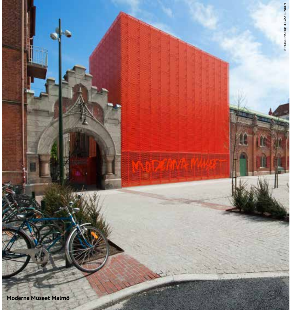
Moderna Museet Malmö