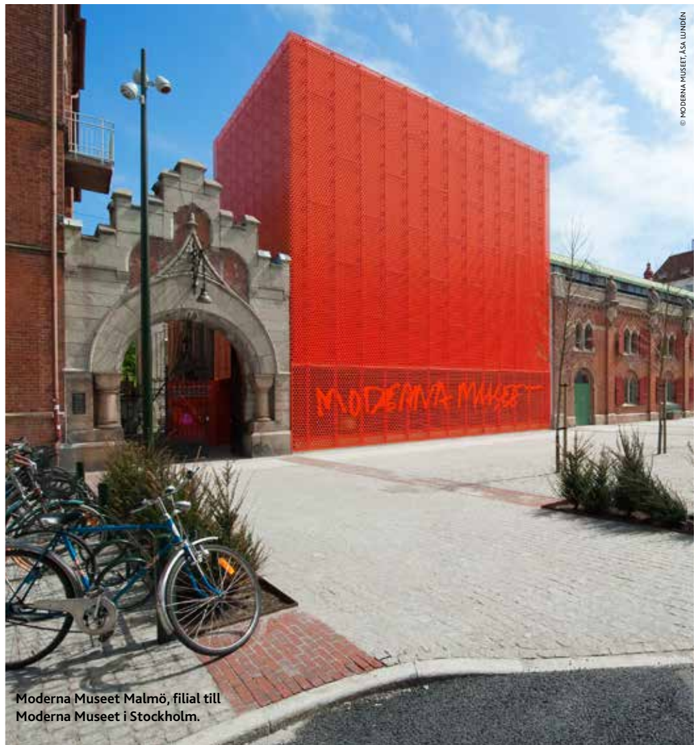
Moderna Museet Malmö, filial till Moderna Museet i Stockholm.