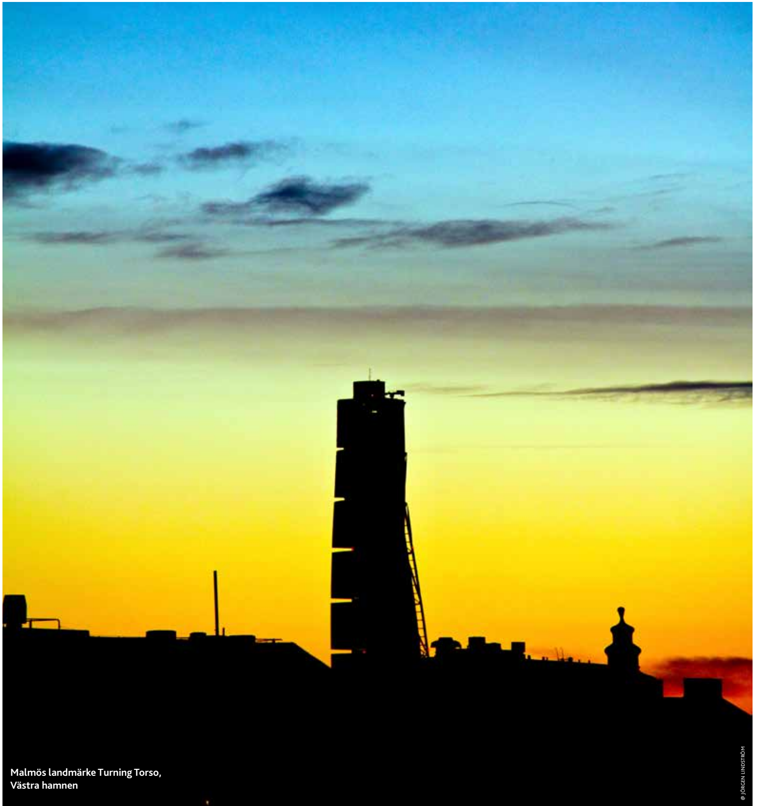
Malmö's landmärke Turning Torso, Västra hamnen